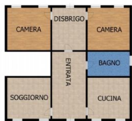
Planimetria Piano Terra