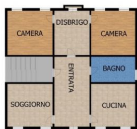
Planimetria Piano Primo

garage; giardino condominiale; 3 camere; 3 servizi; stato: Vuoto