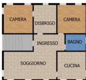
Planimetria Piano Secondo